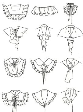
LE DESSIN DE VÊTEMENTS